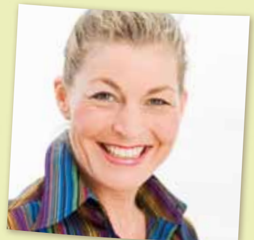
Das Foto ist ein wesentliches Element der Bewerbungsunterlagen.